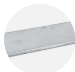
TBC/FBC 2' shelf SHE-CH2