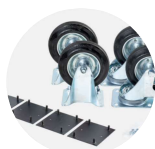
Castor Kit CASS1