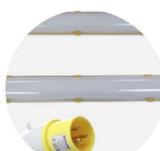
Lighting Kit FRLK-110