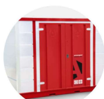
Forma-Stor COSHH FR300-C