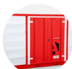
Forma-Stor COSHH FR400-C