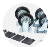
Castor Kit CASS1