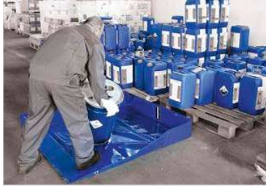
Παράδειγμα της χρήσης