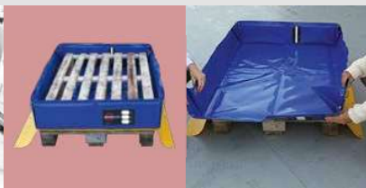
Δυνατότητα προσθήκης της αποχετευτικής τρύπας και σφαιρικής βαλβίδας