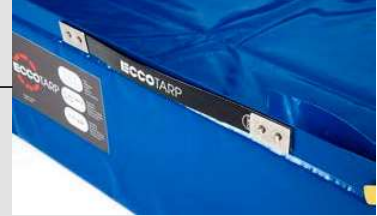
Λεπτομέρεια της πλευρικής λαβής