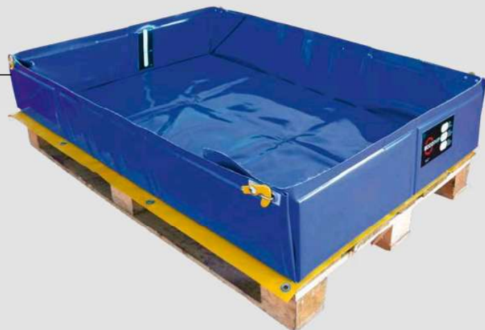
Cargo EUR χωρίς πλαϊνά χερούλια

Χάρη στο σχήμα και το μέγεθος, είναι σχεδιασμένο ειδικά για χρήση στην βιομηχανία και στις μεταφορές