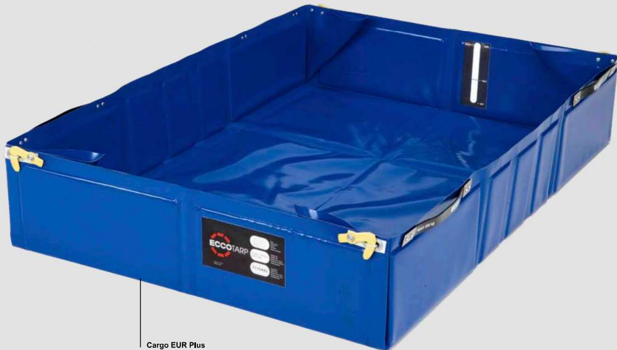
Cargo EUR Plus με πλαϊνά χερούλια