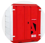
Forma-Stor COSHH FR100-C