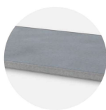
FSC2 shelf SHE-C2