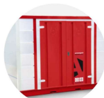
Forma-Stor COSHH FR300-C