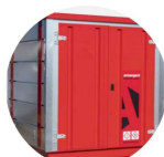
Forma-Stor COSHH FR200-C